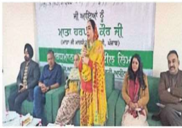
गांव सतोज में संग्रहदा को संबोधित करती संगीत की हस्त मंगीत और « तो अर्धक

जलाल संग्रहदा, संस्कार : जिला प्रशासन संस्कार ने महिला साक्षरता को दिशा में एक और महत्वपूर्ण कदम उठाया है। ग्रामपंचायत संग्रहदा स्टाफ रिजिस्ट्रार के सहयोग से महिला सूक्ष्म उद्यमियों को डिजिटल वित्त साक्षरता के लिए मजबूत करने हेतु मुहूर्तमंत्रि परियोजना के तहत गांव सतोज से पाथलत परियोजना शुरू की है।